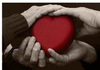
Somatisk helse hos pasienter med alvorlig psykisk lidelse

Rapporten peker på at somatisk sykdom ofte blir oversett hos personer med alvorlig psykisk lidelse. Den psykiske lidelsen kan overskygge symptomer på annen sykdom. Dette fører til både manglende akutt- og forebyggende helsehjelp. Somatisk oversykkelighet og samtidig underbehandling hos pasienter med alvorlig psykisk lidelse, fører til mange tapte leveår.