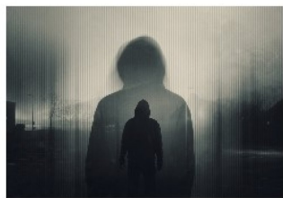
Helsehjelp til personer med alvorlig psykisk lidelse og voldsrisiko

Rapporten peker på faktorer som førte til at en person med alvorlig psykisk lidelse og voldsrisiko gikk «under radaren» og ikke ble fanget opp av helse- og omsorgstjenesten. Funnene viser at det kan være utfordrende å vurdere samtykkekompetanse, både fra faglige, etiske og juridiske perspektiver. Rapporten framhever viktigheten av pårørendeinvolvering i behandlingen, samt ivaretagelse av pårørende. Videre peker rapporten på ivaretagelsen av samfunnsvernet og hvordan uavklarte ansvarsforhold mellom spesialisthelsetjenesten, kommune- og justissektoeren kan føre til at pasienter ikke fanges opp. Voldsrisiko må vurderes på bakgrunn av oppdatert informasjon og for å forebygge framtidig vold er det viktig at oppfølgingstiltak bygger på de kartlagte risikofaktorene. I rapporten omtaler vi også viktigheten av å vurdere farevilkåret.