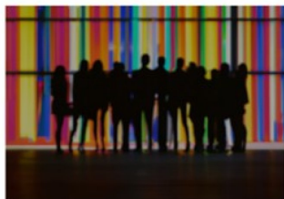
Pasientsikkerhet for barn og unge med kjønnsinkongruens

Hovedbudskapet i rapporten er en bekymring for pasientsikkerheten til barn og unge med kjønnsinkongruens. Feltet trenger tydeligere rammer for å bedre pasientsikkerheten. I rapporten peker vi på at det forskningsbaserte kunnskapsgrunnet, for pubertetsutsettende og kjønnsbekreftende behandling (hormonell og kirurgisk) er mangelfullt. Langtidseffektene er i liten