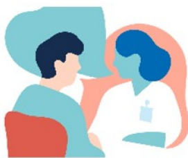
Erfaringer fra kollegastøtteordninger

Gjennom våre undersøkelser av alvorlige uønskede hendelser erfarer vi at helsepersonell uttrykker behov for mer systematisk ivaretagelse av den enkelte når noe går galt. Trygge ansatte og stabilitet i stillingene i helse- og omsorgstjenesten er viktig for pasientsikkerheten. Vår undersøkelse viser at det er stor variasjon i tilbudet om kollegastøtte mellom virksomheter, og mellom yrkesgrupper. Mens leger, psykologer og tannleger har egne ordninger for kollegastøtte i hele landet via sine yrkesforeninger, finner vi i ingen eller svært liten grad det tilsvarende tilbud for