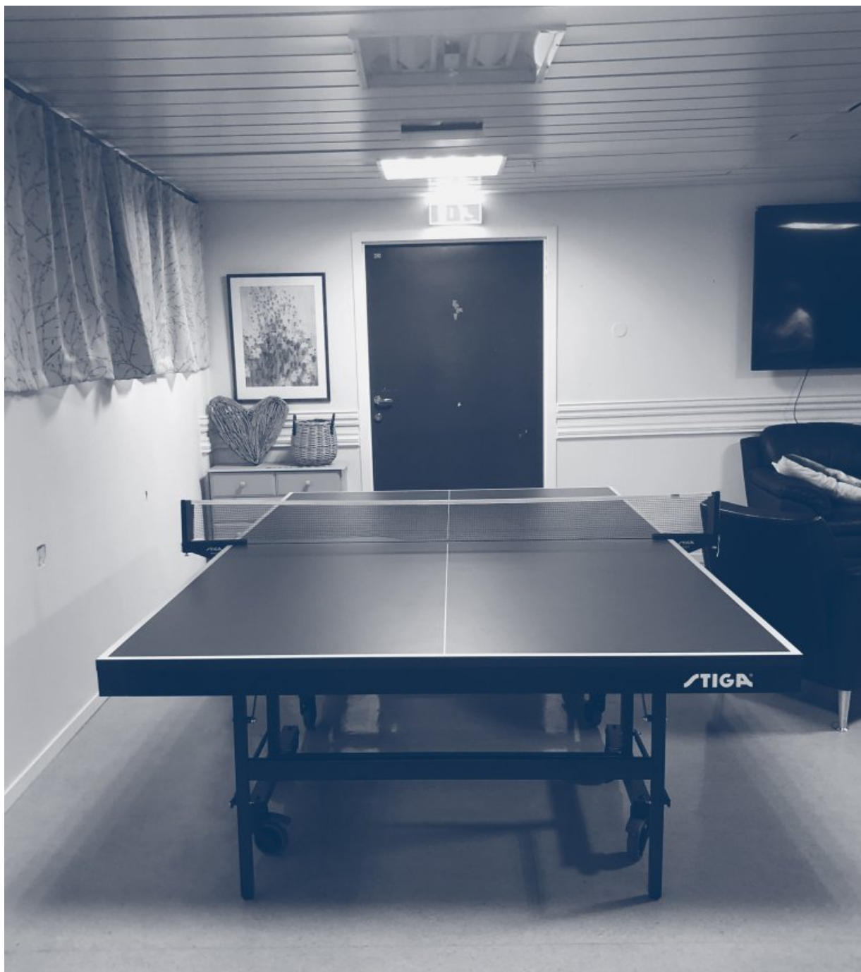
Aktivitetsrom på sikkerhetsposten der pasienten når er.

På den tiden Frank er innlagt før drapet har ikke den aktuelle sikkerhetsposten rutiner som sier at alle pasienter skal ha en voldsrisikovurdering. I dag gjennomfører de, ifølge overlegen, en full voldsrisikovurdering med HCR-20 unntatt i de tilfellene der de vurderer at det ikke er nødvendig.