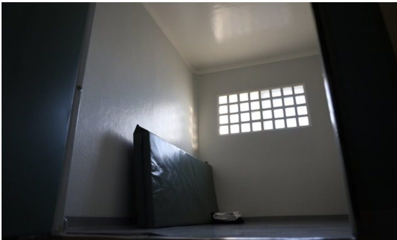
Eksempel på en sikkerhetscelle fra et norsk fengsel.

konfliktdempende praksis, og større bevissthet om skadevirkningene av isolasjon. Dette viser at strukturert arbeid kan redusere isolasjon også i krevende miljøer. Endringsarbeidet skjedde etter at Sivilombudet publiserte en rapport der de beskrev situasjonen ved Skien fengsel som alvorlig (62).