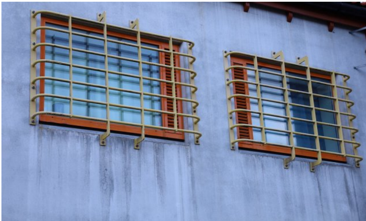
Eksempelbilde fra et norsk fengsel.