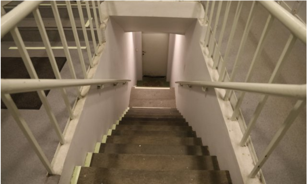
Trappegang ned til sikkerhetscelle – eksempel fra et norsk fengsel.