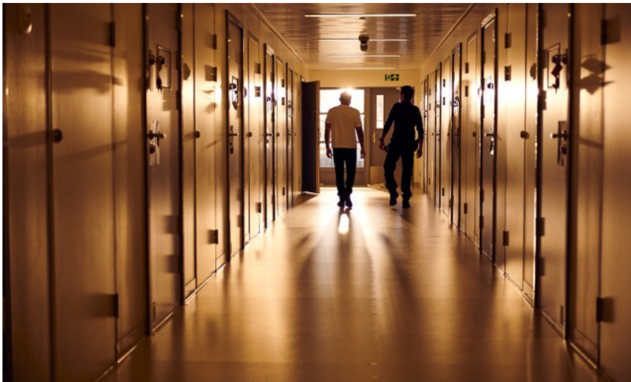
Eksempelbilde fra et norsk fengsel.