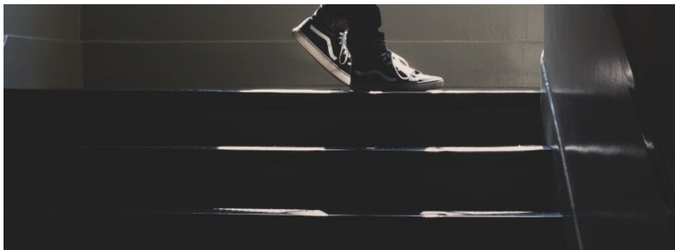
Fra rapporten "Ungdom med uavklart tilstand".

I rapporten fremhever Ukom viktigheten av samhandling og dialog mellom offentlige tjenestetilbud og familier for å ivareta barn og unge psykiske helse på en god måte. Uten samhandling mellom de ulike aktørene innen oppvekstfeltet kan foreldre oppleve å stå alene i å ivareta helheten i barnets komplekse behov. Barn og unge trenger et fungerende sikkerhetsnett som sørger for helhetlig og tilstrekkelig oppfølging når endringer fanges opp av foreldre eller skole. Optimalt er sikkerhetsnettet et team bestående av for eksempel skole, fastlege, skolehelsetjeneste, pedagogisk psykologisk tjeneste (PPT), Familiens hus, barnevernstjenesten og barne- og ungdomspsykiatrisk poliklinikk (BUP). Foreldre og søsken er viktige medspillere i dette teamet.