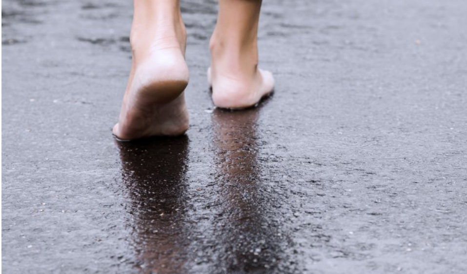
Fra rapporten "Ingen kan hjelpe meg" - hvorfor ble Malin nødetatenes oppgave?

Foreldrene visste ikke hvor de kunne henvende seg i helsetjenesten når de var bekymret for henne.