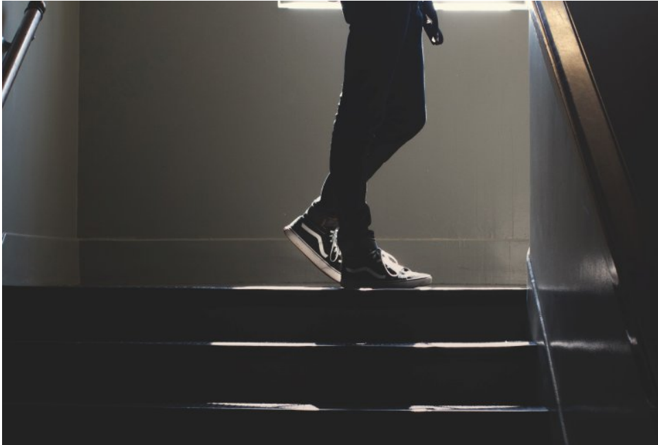
Fra rapporten "Ungdom med uavklart tilstand".

I rapporten fremhever Ukom viktigheten av samhandling og dialog mellom offentlige tjenestetilbud og familier for å ivareta barn og unge psykiske helse på en god måte. Uten samhandling mellom de ulike aktørene innen oppvekstfeltet kan foreldre oppleve å stå alene i å ivareta helheten i barnets komplekse behov. Barn og unge trenger et fungerende sikkerhetsnett som sørger for helhetlig og tilstrekkelig oppfølging når endringer fanges opp av foreldre eller skole. Optimalt er sikkerhetsnettet et team bestående av for eksempel skole, fastlege, skolehelsetjeneste, pedagogisk psykologisk tjeneste (PPT), Familiens hus, barnevernstjenesten og barne- og ungdomspsykiatrisk poliklinikk (BUP). Foreldre og søsken er viktige medspillere i dette teamet.